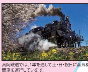
真岡鉄道では、1年を通して土・日・祝日に蒸気機関車を運行しています。