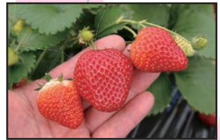
日本一のいちごの街・真岡市のいちご。各フレッシュ直売所や道の駅にのみやで販売中です。