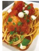
テイクアウトパスタランチ(一例)