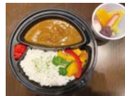
牛すじカレー&ミニあんみつセット