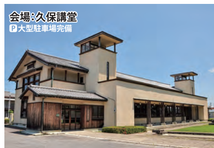
栃木県真岡市田町1345-1 旧真岡市科学教育センター北側 砂利駐車場北